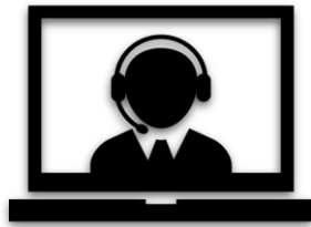
IT und DMS