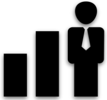
Buchhaltung und Controlling